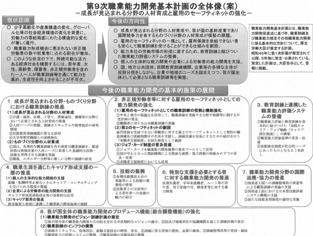
図1-1 第9次職業能力開発計画の全体像

その中で、個人の主体的な能力開発の支援及び企業による労働者の能力開発の支援を目的とした「職業生涯を通じたキャリア形成支援の一層の推進」を図るとともに、多様な主体（国、地方公共団体、民間教育訓練機関、企業等）の適切な役割分担による企業や地域のニーズを踏まえた職業訓練の実施に向けた国全体の職業能力開発についてのビジョン策定、訓練カリキュラムや職業能力評価システム等の職業能力開発のインフラ整備を行うプロデュース機能（総合調整機能）を戦略的に強化することが必要であるとされた。（図1-1）