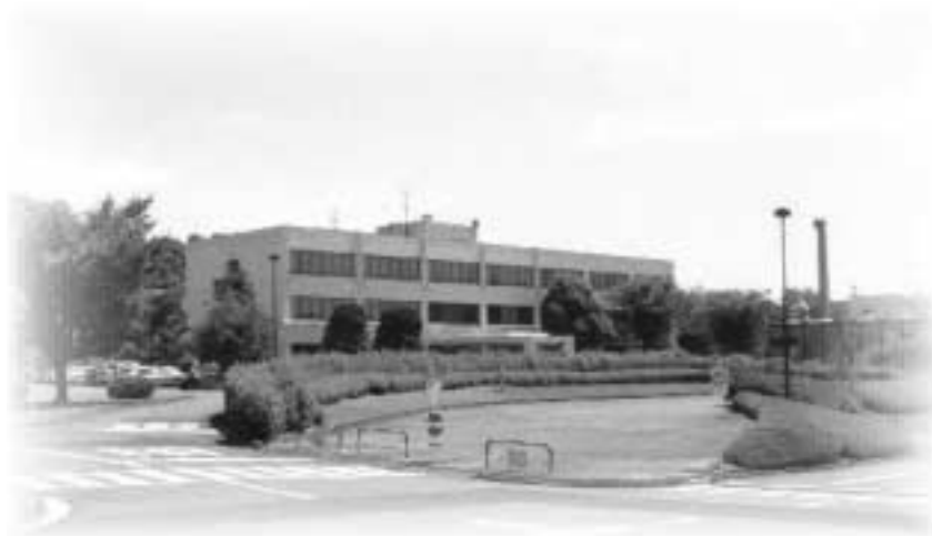
能力開発研究センター